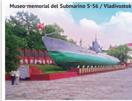
Museo-memorial del Submarino S-56 / Vladivostok