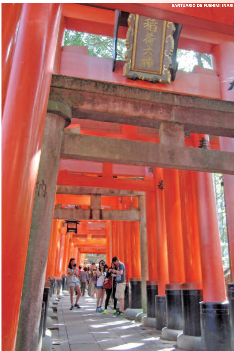
SANTUARIO DE FUSHIMI INARI

Traslado al aeropuerto en coche privado y acompañados de nuestro asistente privado de habla hispana. Salida en vuelo regular de Lufthansa a España (via Munich o Frankfurt). Llegada y fin de nuestros servicios.