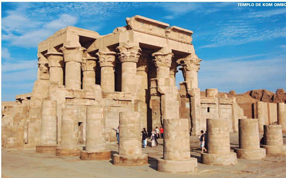
TEMPLO DE KOM OMBO

11 días (4n barco + 6n hoteles) desde 1.180 €