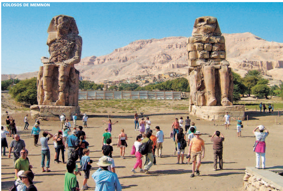
COLOSOS DE MEMNON

Por la mañana visita panorámica de las Pirámides Keops, Kefren y Micerinos. Paseo por el recinto para acercarnos a La Esfinge y a cada una de las tres pirámides; opcionalmente se podrá entrar para ver las cámaras funerarias. Accederemos a una zona más alta para contemplar una impresionante vista panorámica de estas construcciones es que han sobrevivido