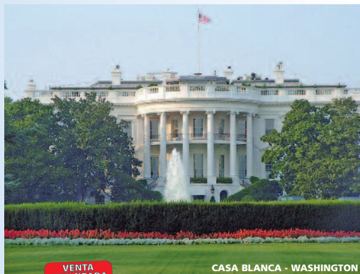
CASA BLANCA - WASHINGTON

VENTA ANTICIPADA D Descuento 5% | 8% PLAZAS LIMITADAS