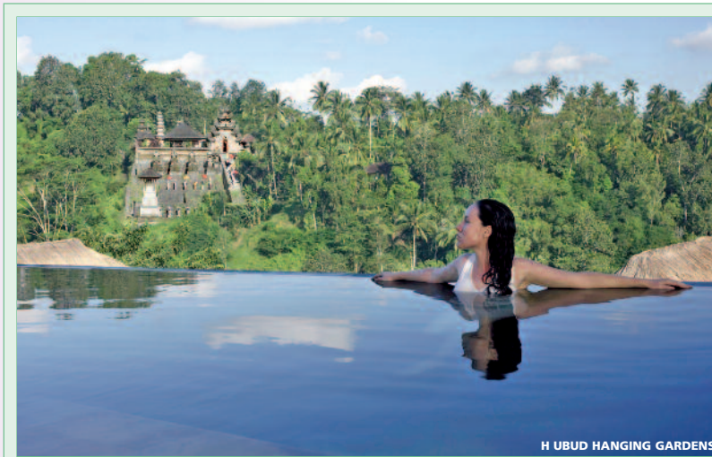
H UBUD HANGING GARDENS