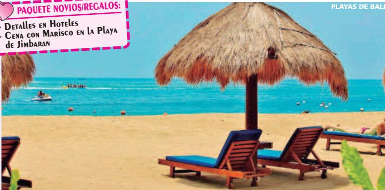
PLAYAS DE BALI

PAQUETE NOVIOS/REGALOS: - DETALLES EN HOTELES - CENA CON MARISCO EN LA PLAYA DE JIMBARAN