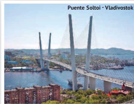
Puente Soltoy - Vladivostok