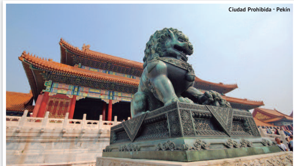
Ciudad Prohibida - Pekín

Paquete aéreo aproximado, pendiente de confirmar al hacer la reserva