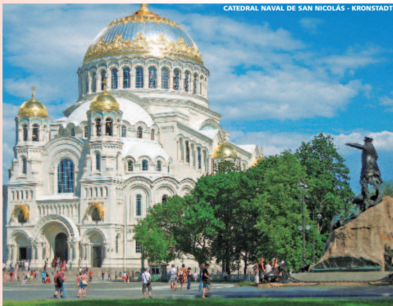
CATEDRAL NAVAL DE SAN NICOLÁS - KRONSTADT

• Miércoles • Pensión Completa. Por la mañana realizaremos la visita de la Catedral de San Isaac , una de las mayores de Europa, diseñada y construida por prestigiosos arquitectos, entre los que destacan el español Agustín de Betancourt y el francés Auguste de Montferrand. La cúpula está recubierta de 100 kg de oro. Posteriormente visitaremos el Museo del Vodka donde los guías le contarán historias acerca de ésta tradicional bebida. Podrá además degustar algunas variedades acompañadas de "pinchos" rusos. Por la tarde visita al Museo del Hermitage , situado en el antiguo Palacio de Invierno, residencia de los Zares. El Hermitage es el museo más grande de Rusia, debe su renombre internacional en especial a sus colecciones de pintura de las escuelas italiana, flamenca, francesa y española. En particular, obras de Leonardo da Vinci, Rafael y Rembrandt; de impresionistas franceses, de Gauguin, Matisse; Van Gogh, Picasso, etc. Sus suntuosos interiores