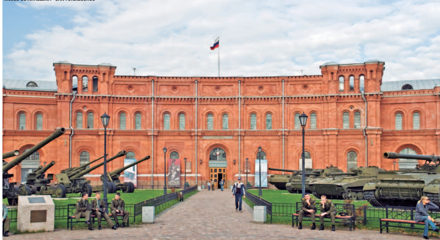
MUSEO DE ARTILLERÍA - SAN PETERSBURGO