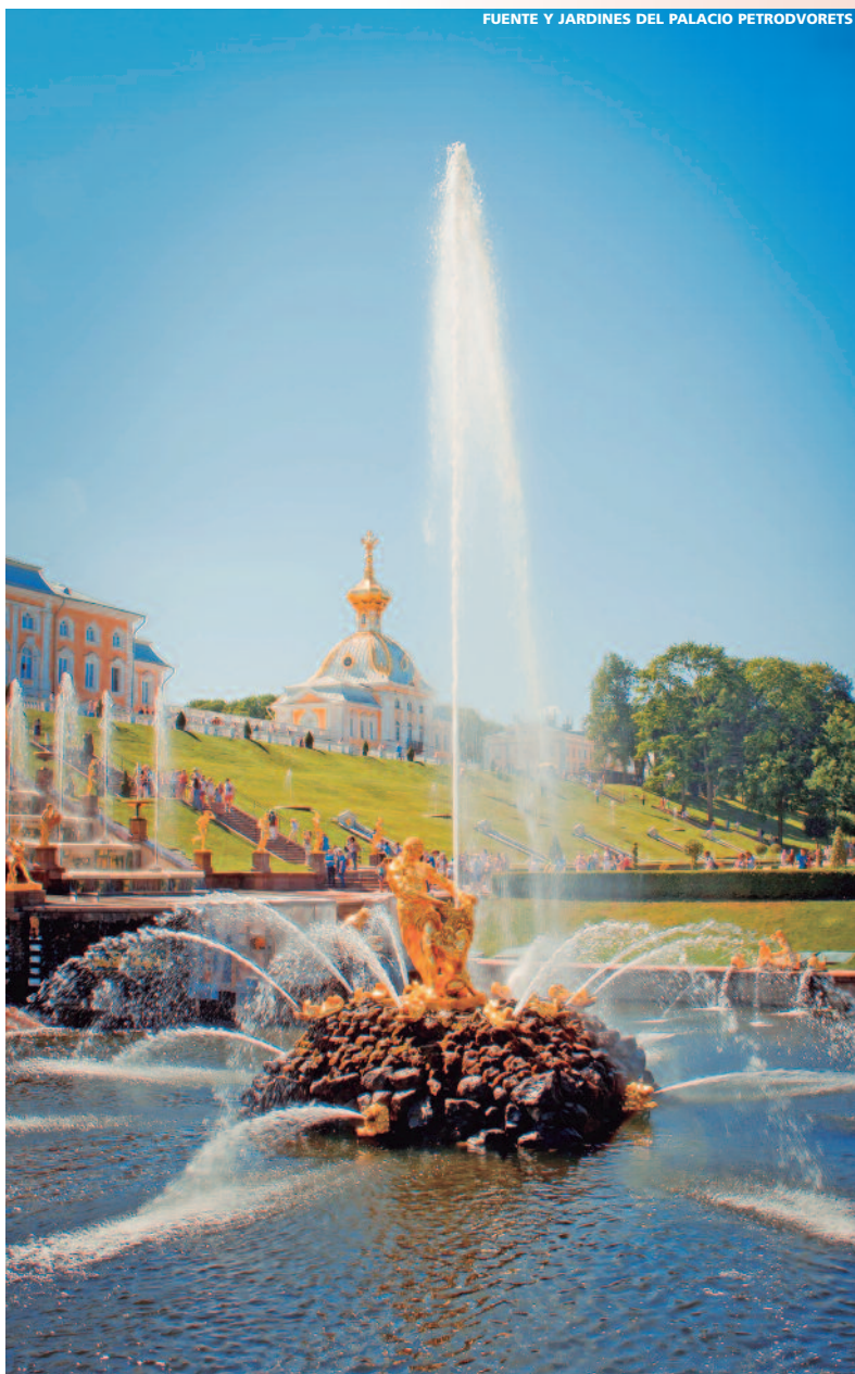
FUENTE Y JARDINES DEL PALACIO PETRODVORETS

Traslado al aeropuerto para tomar el vuelo de regreso a España.