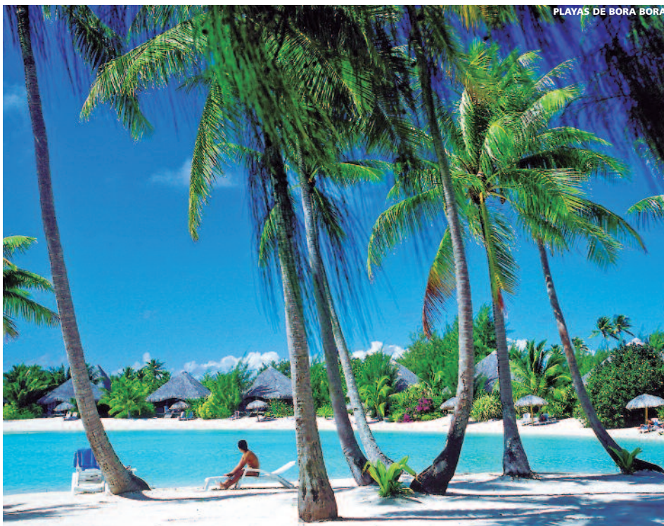
PLAYAS DE BORA BORA