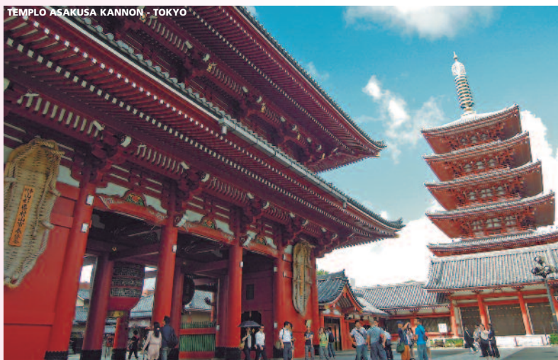
TEMPLO ASAKUSA KANNON - TOKYO

Días 7º y 8º Tokyo • Sábado y Domingo • Desayuno. Días libres a disposición de los pasajeros en los que les ofrecemos realizar excursiones opcionales: Kyoto , la antigua capital del país hasta el traslado de la corte a Tokyo (Edo) por parte del emperador Meiji; podrán conocer el templo de Ryoanji,