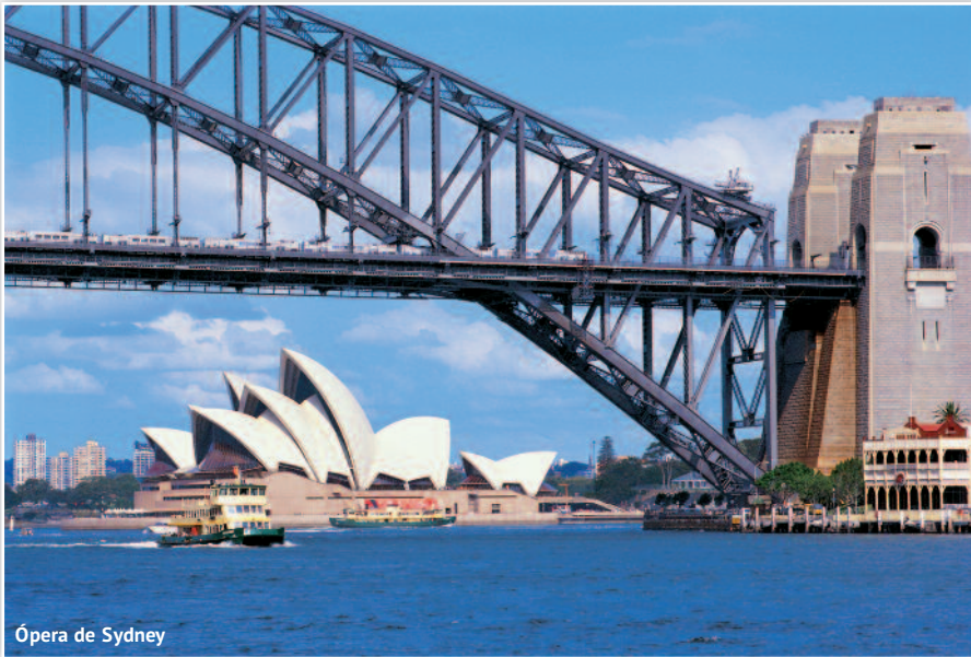
Ópera de Sydney