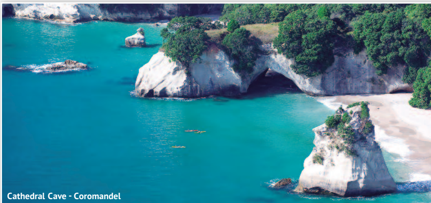
Cathedral Cave - Coromandel

A bordo, la cía. Naviera le ofrecerá en algunos puertos una gran variedad de excursiones opcionales en inglés. Si desea alguna visita con guía local de habla hispana, consulte con nosotros, al mismo precio o más económica.