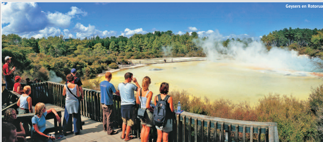
Geysers en Rotorua