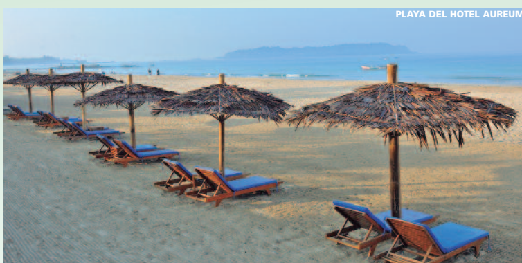
PLAYA DEL HOTEL AUREUM

Reconfirmar precios a partir del 1 de Octubre de 2018