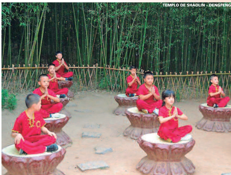
TEMPLO DE SHAOLIN - DENG FENG

Consultar salidas desde otras provincias