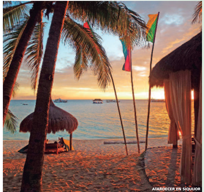
ATARDECER EN SIQUIJOR