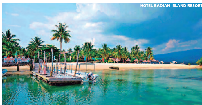
HOTEL BADIAN ISLAND RESORT

Notas: Rogamos consultar alojamiento en otros hoteles y en otro tipo de habitaciones. Fechas de disponibilidad limitada, posible cierre de ventas. Consultar suplementos en el momento de reserva: 20/30 Sep 18 (WSL Surfing Competition); 25 Mar/2 Abr 2018 (Semana Santa); 24 Dic 2018/2 Ene 2019 (Navidad). Consultar suplementos y condiciones para Navidad, Año Nuevo Chino, Semana Santa, ferias, congresos y competiciones de buceo.