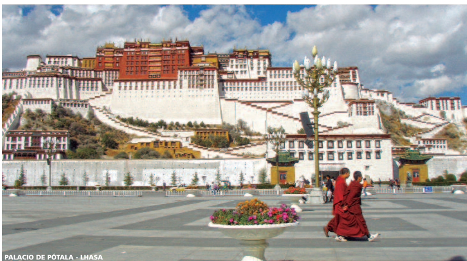
PALACIO DE PÓTALA - LHASA

Incluyendo 14 DESAYUNOS , 5 ALMUERZOS , CENA PATO LAQUEADO + 13 VISITAS y ESPECTÁCULO ACROBACIA en PEKIN