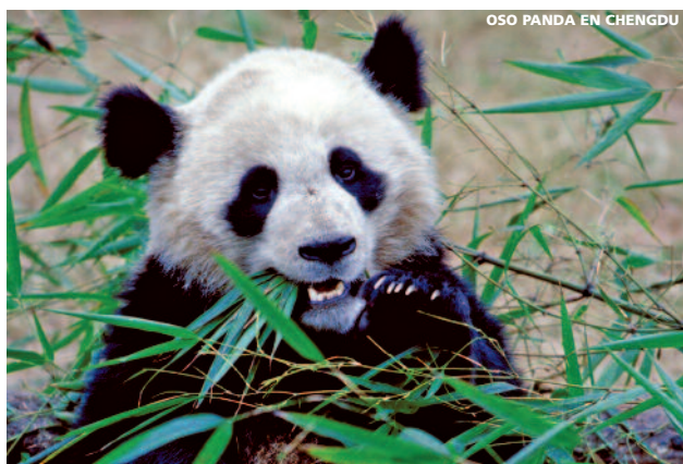
OSO PANDA EN CHENGDU

14 días (12n. hotel + 1n. avión) desde 2.720 €