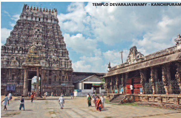
TEMPLO DEVARAJASWAMY - KANCHIPURAM