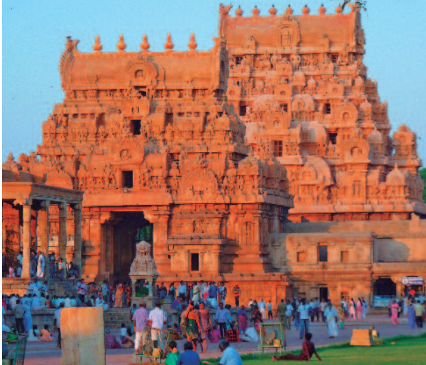
TEMPLO BRIHADESWARA - TANJORE

recorrido en barco por el Lago Periyar , reserva de vida animal en el estado de Kerala, donde podremos admirar su flora y su fauna. Alojamiento en el hotel.