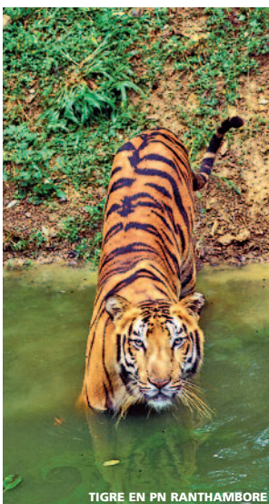
TIGRE EN PN RANTHAMBORE