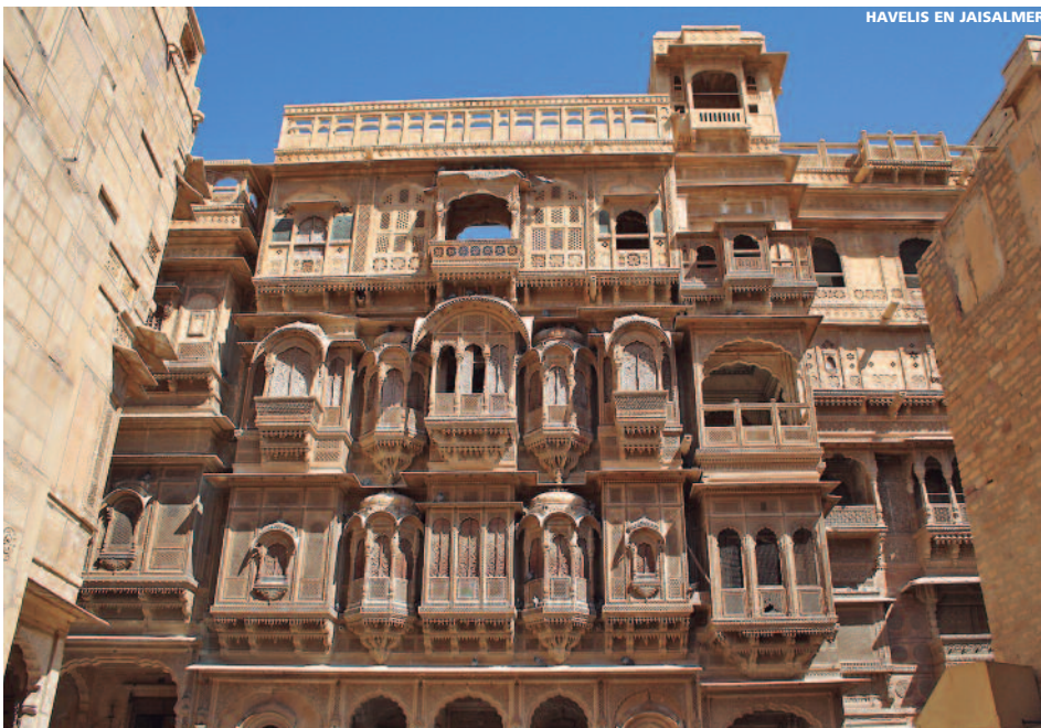
HAVELIS EN JAISALMER

Descuento por no utilizar el vuelo..... - 185