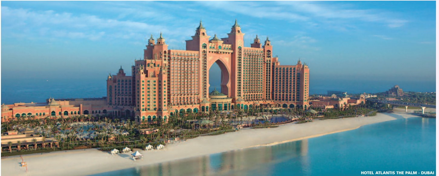
HOTEL ATLANTIS THE PALM - DUBAI

Parada válida para todos los programas de este folleto volando con la Cía. Emirates