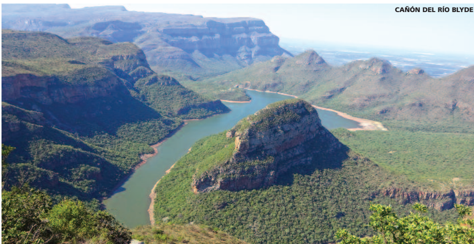
CAÑÓN DEL RÍO BLYDE

12 días (9n hotel + 2n avión) desde 2.860 €