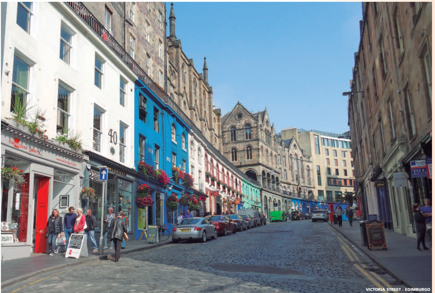
VICTORIA STREET - EDIMBURGO

del almuerzo (no incluido) y tiempo libre. Continuamos hacia el espectacular valle de Glencoe, hasta llegar a Luss , un precioso pueblo considerado área de conservación histórica, situado a orillas del Lago Lomond. Llegada a Glasgow . Alojamiento.