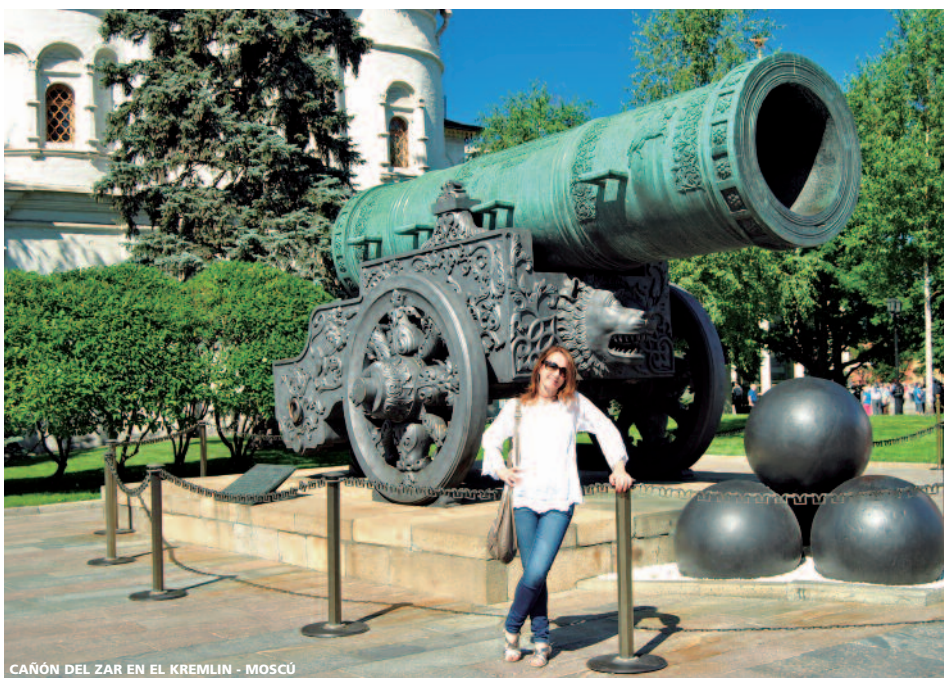
CAÑÓN DEL ZAR EN EL KREMLIN - MOSCÚ