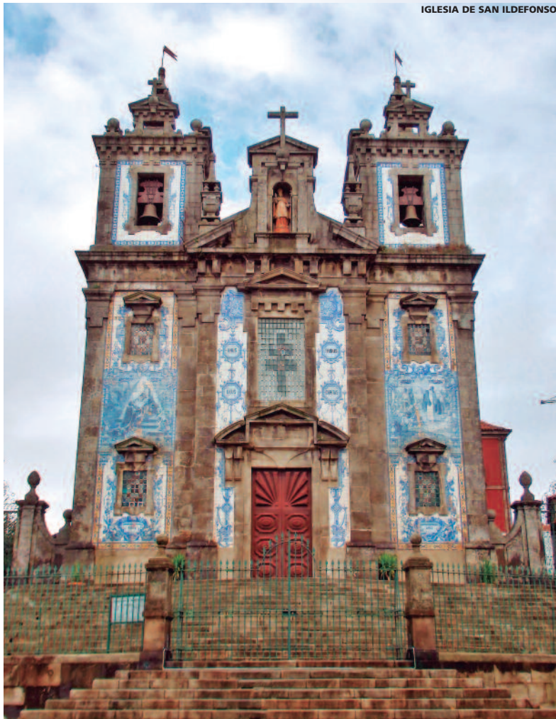
IGLESIA DE SAN ILDEFONSO