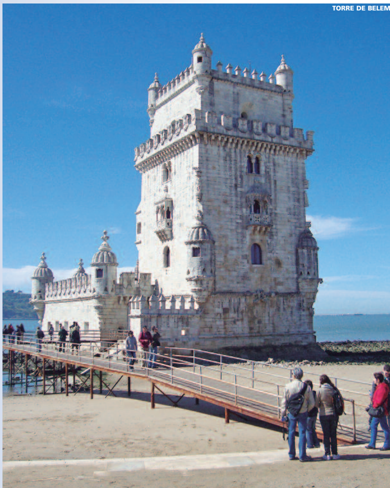
TORRE DE BELEM