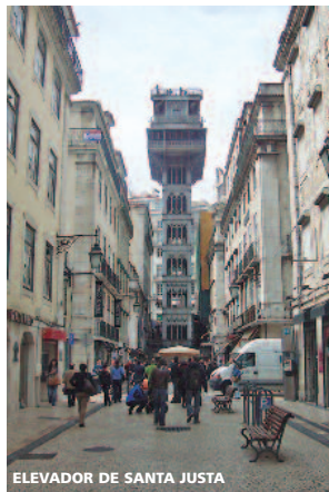
ELEVADOR DE SANTA JUSTA