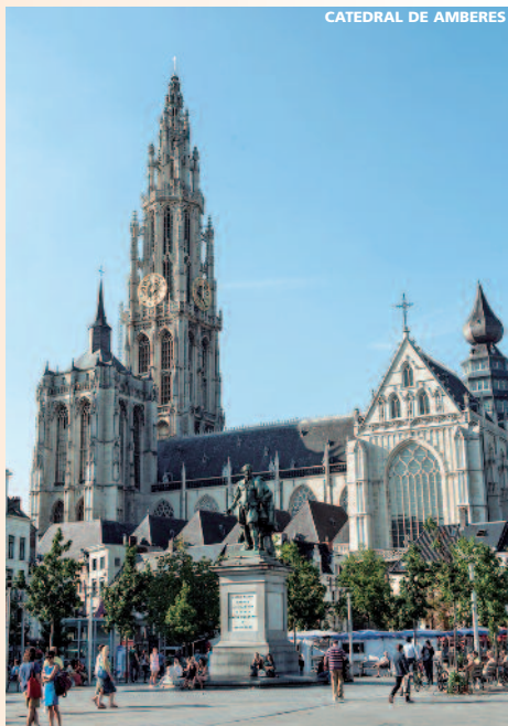
CATEDRAL DE AMBERES