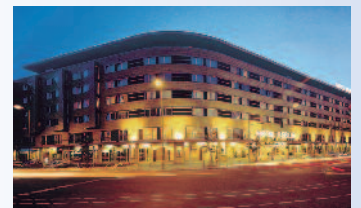
5 H. BERLIN 4*S Lützowplatz, 17 – Tel. 030 26052911

Situado en el centro de Berlín, está a poca distancia en transporte de Brandenburger, y la estación más cercana es Alexanderplatz. El hotel tiene 3 restaurantes, 2 bares, un salón de convenciones, una cafetería y un gimnasio. Las 1012 habitaciones están equipadas con minibar, secador de pelo, aire acondicionado, etc.