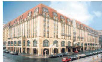
10 H. HILTON 5* Mohrem Str., 30 – Tel. 030 20230

Ubicado en el propio centro de Berlín, cerca de Potsdamer Platz y Checkpoint Charlie. El hotel ofrece 392 espaciosas habitaciones, con decoración de muebles de madera oscura, colores naturales y tonos cálidos, y que cuentan con aire acondicionado, minibar, caja fuerte, conexión a internet wi-fi, TV vía satélite, etc.