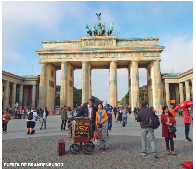
PUERTA DE BRANDENBURGO