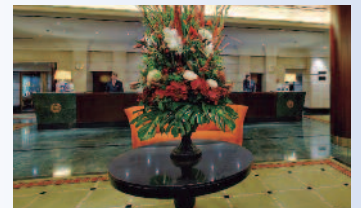
11 H. KEMPINSKI BRISTOL 5* Kurfürstendamm, 27 – Tel. 030 884340

Situado junto a la Gendarmenmarkt, a unos 2 minutos caminando de Friedrichstrasse, muy cerca de la puerta de Brandenburgo y del Reichstag. Habitaciones (algunas para no fumadores y discapacitados) equipadas con baño/ducha, TV., teléfono, aire acondicionado, minibar, secador de pelo, etc. Dispone de restaurantes, bares, etc.