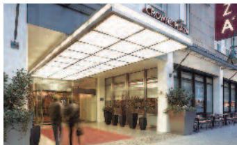
6 H. CROWNE PLAZA 4* Nürnberg Strasse, 65 – Tel. 030 210070

Representando una perfecta mezcla entre lo clásico y lo moderno, el hotel consta de 701 habitaciones. A pocos minutos del parque Tiergarten y de la Kadeve, el centro comercial más famoso de Berlín. Dispone de aire acondicionado, secador, teléfono, hotel, restaurante, bar, gimnasio, sauna, sala de reuniones, etc.