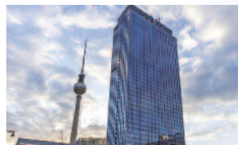
4 H. PARK INN 4* Alexanderplatz, 7 – Tel. 030 023890

Abierto desde el 1 Agosto 2009. Situado en el corazón de Berlín, este hotel ofrece a sus huéspedes un bar y 274 habitaciones modernas con un diseño contemporáneo y mobiliario de mejor calidad. Las habitaciones están dotadas de baño, teléfono, caja fuerte y aire acondicionado.