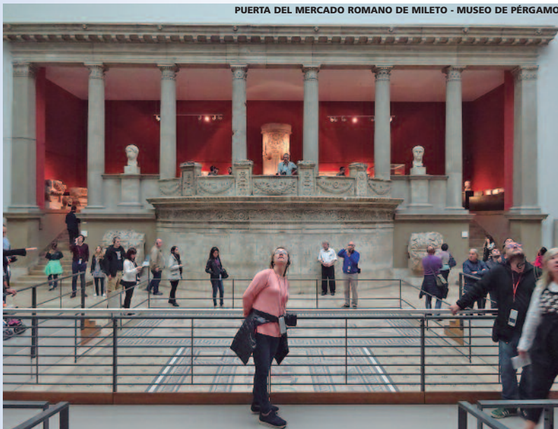
PUERTA DEL MERCADO ROMANO DE MILETO - MUSEO DE PÉRGAMO