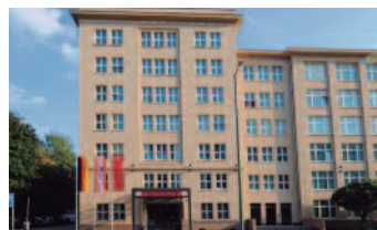
3 H. ROYAL 4* Otto Braun Strasse, 10 – Tel. 030 7554310

Hotel situado en el centro de Berlín y el año de apertura fue 2009. Está cerca de Hackesche Höfe y la estación más cercana es Rosenthaler Platz. El hotel tiene un restaurante un bar y una cafetería. Las 163 habitaciones están equipadas con secador de pelo, caja de seguridad y aire acondicionado.