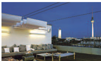
1 H. AMANO 3* Auguststraße, 43 – Tel. 030 8094150

Hotel situado en el centro de Berlín y el año de apertura fue 2009. Está cerca de Hackesche Höfe y la estación más cercana es Rosenthaler Platz. El hotel tiene un restaurante un bar y una cafetería. Las 163 habitaciones están equipadas con secador de pelo, caja de seguridad y aire acondicionado.