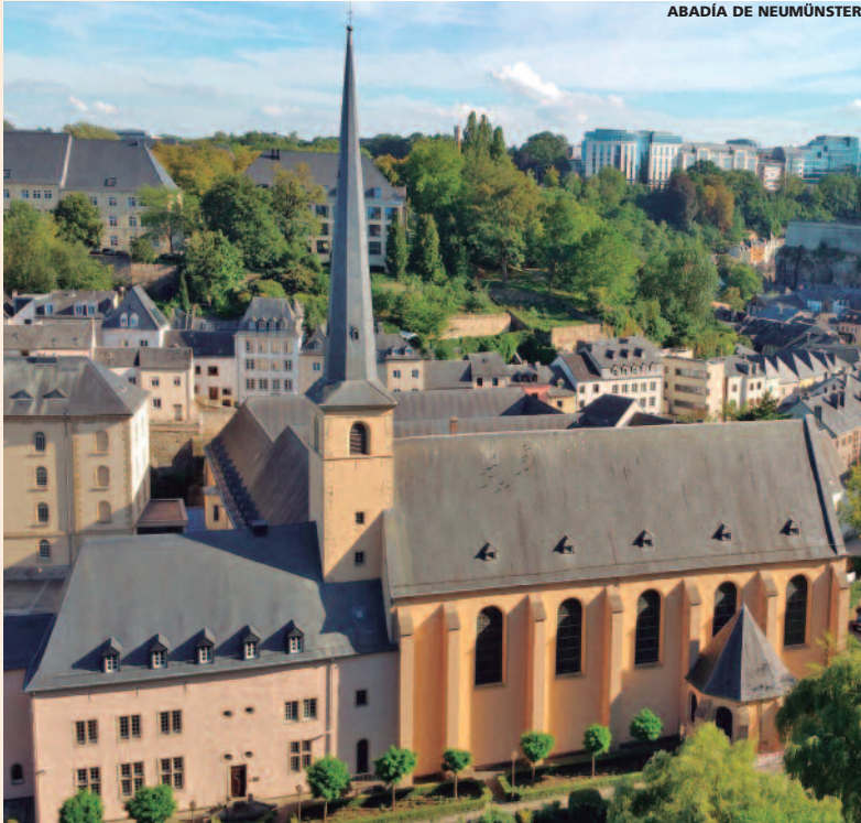
ABADÍA DE NEUMÜNSTER