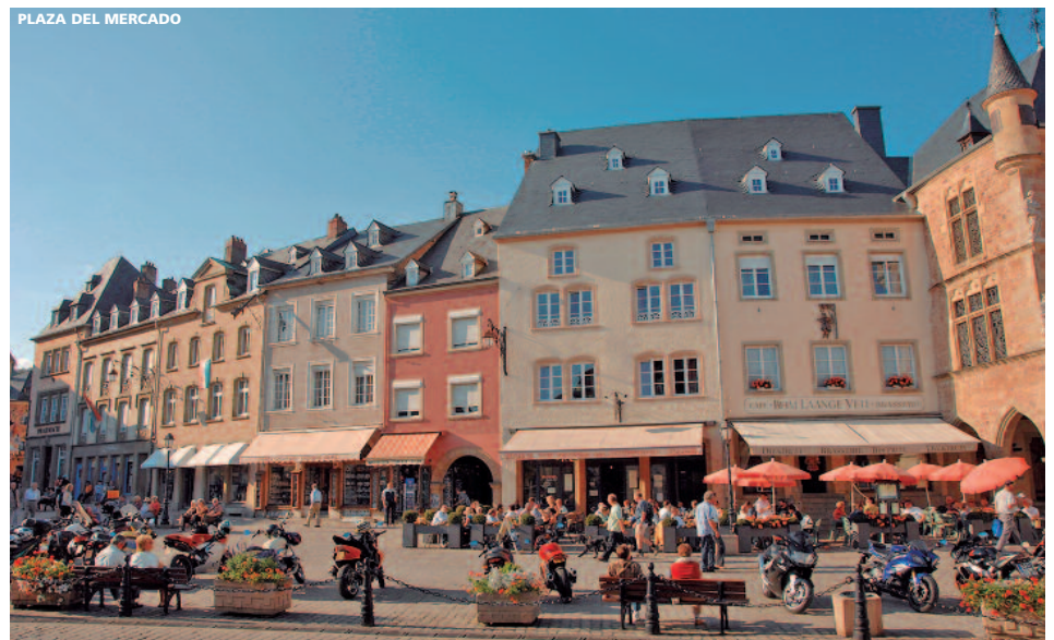
PLAZA DEL MERCADO

(Traslado al aeropuerto por cuenta de los Sres. Clientes). Salida en vuelo de la Cía. Luxair con destino a Madrid o Barcelona.