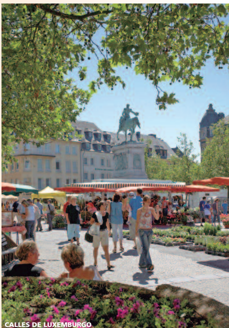
CALLES DE LUXEMBURGO