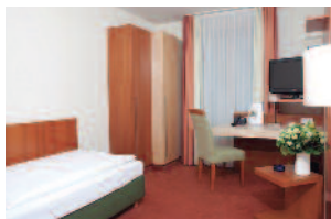
① H. FLANDRISCHER HOF 3* Flandrischer Strasse, 3 – Tel. 221 20 36