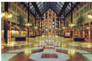
② H. MARITIM 4*5 Heumarkt, 20 – Tel. 022 12 02 70