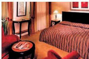
③ H. DOM 5* Domkloster, 2A – Tel. 221 202 40