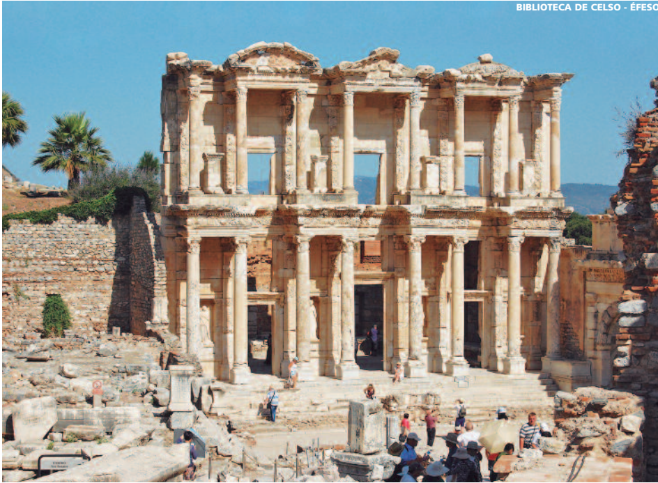
BIBLIOTECA DE CELSO - ÉFESO