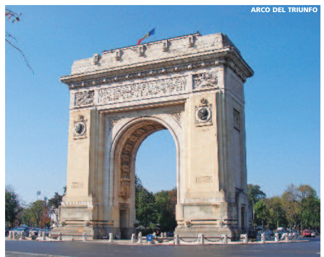
ARCO DEL TRIUNFO

Seguros Exclusivos AXA de gastos de anulación y otros (a contratar al reservar) desde..... 29 Tasas de aeropuerto..... Consultar