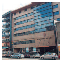
③ H. CAPITAL PLAZA 4*S Bulevardul Iancu de Hunedoara, 54 Tel. (40) 21/372080080