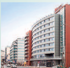
① H. IBIS PARLAMENT 3*S 82-84 Izvor Street, București Tel. (40) 21/4011000