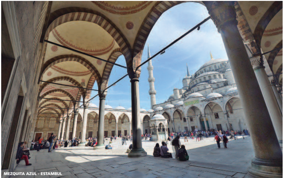
MEZQUITA AZUL - ESTAMBUL