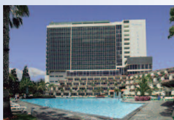
H. PESTANA CARLTON OCEAN RESORT 5* Largo António Nobre, 1 – Tel. 291 239 500