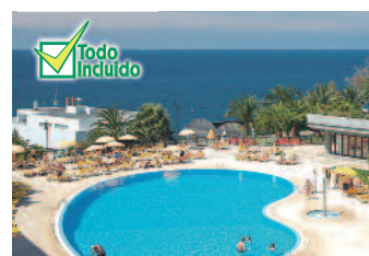
H. ENOTEL LIDO RESORT & SPA 5* (Rég. T.I.) Rua Simplicio dos Passos Gouveia, 29 – Tel. 291 724 239