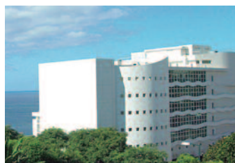
H. MELIA MADEIRA MARE RESORT & SPA 5* Rua de Leichlingen, 2 – Tel. 291 724 140