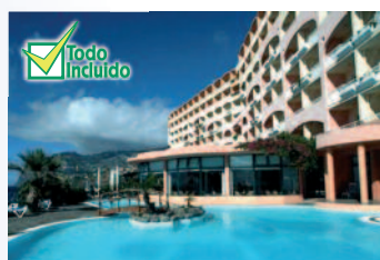
H. PESTANA BAY OCEAN 4* (Rég. T.I.) Praia Formosa – Tel. 291 701 900