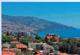
H. DORISOL BUGANVILLA 3* Rua Da Casa Branca, 98 – Tel. 291 706 615