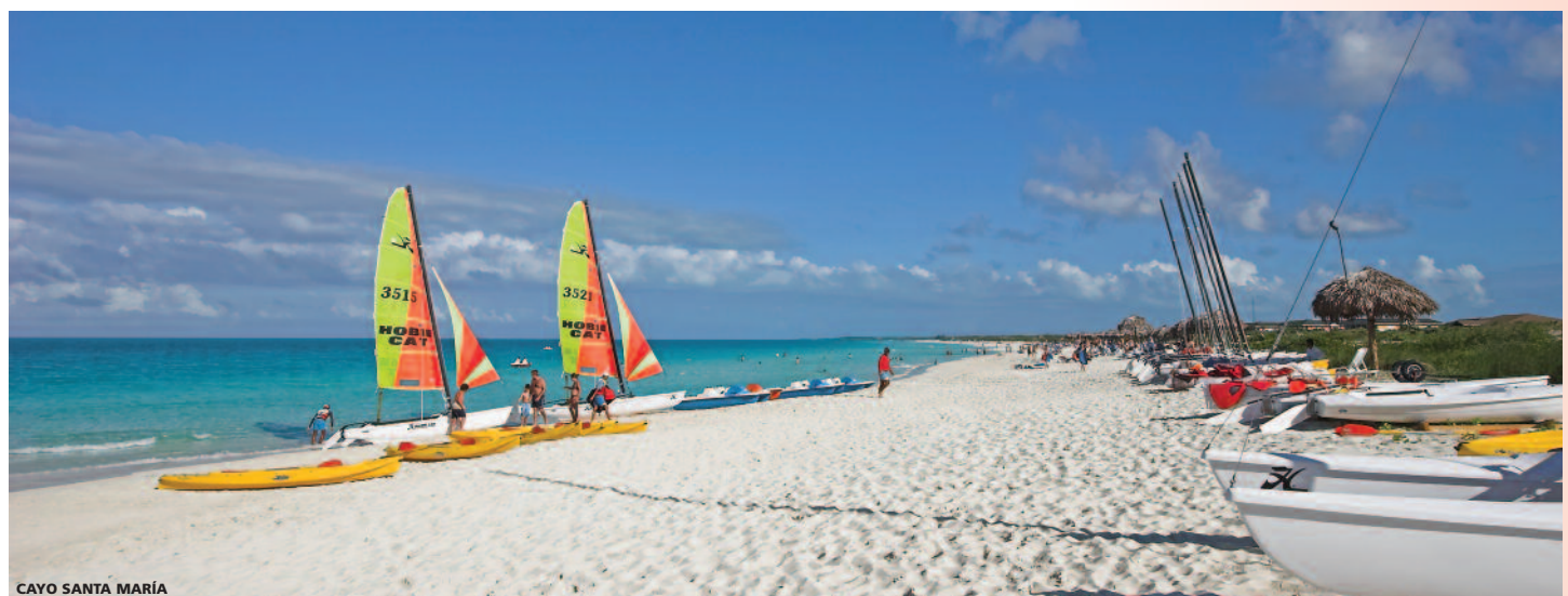
CAYO SANTA MARÍA