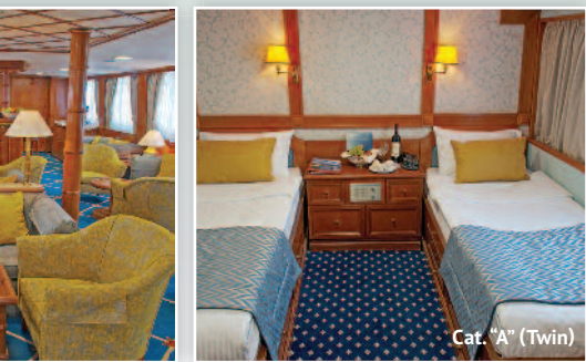
Cat. "A" (Twin)