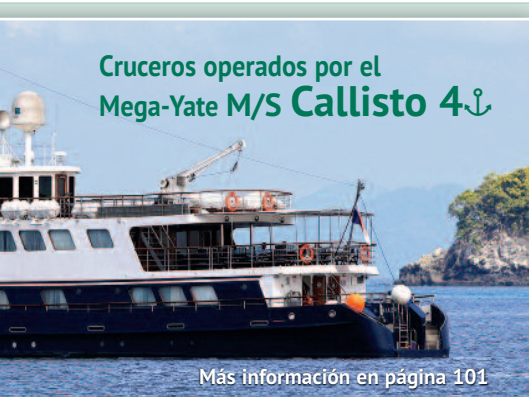
Cruceros operados por el Mega-Yate M/S Callisto 4