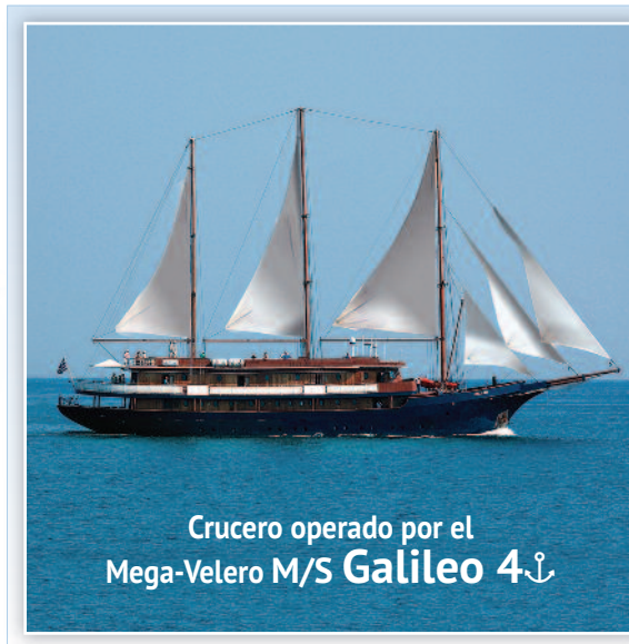
Crucero operado por el Mega-Velero M/S Galileo 4