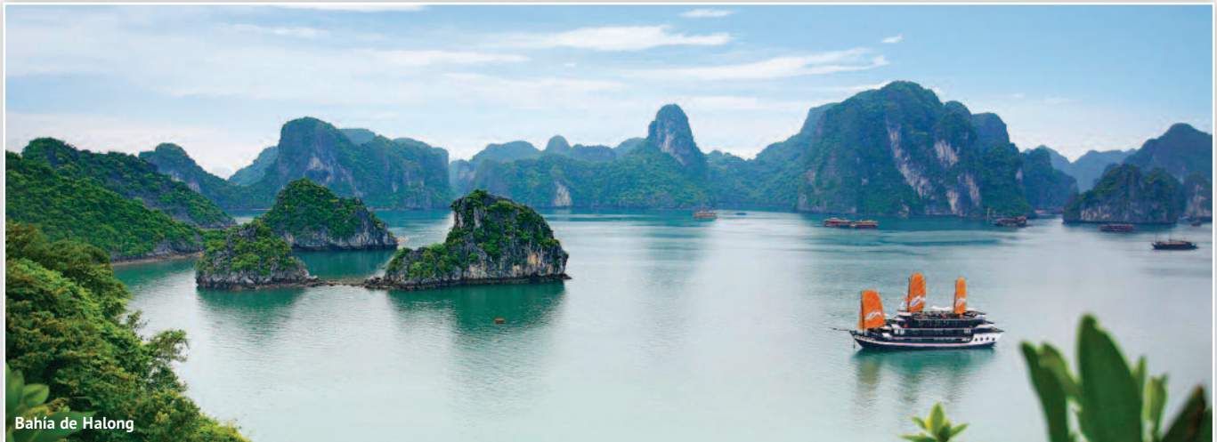
Bahía de Halong