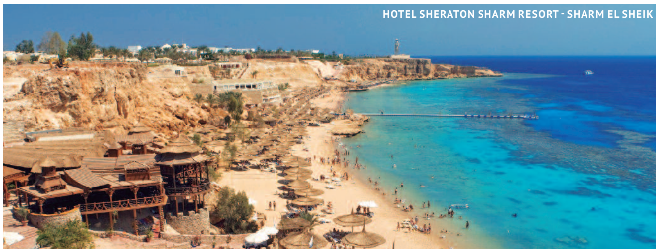
HOTEL SHERATON SHARM RESORT - SHARM EL SHEIK