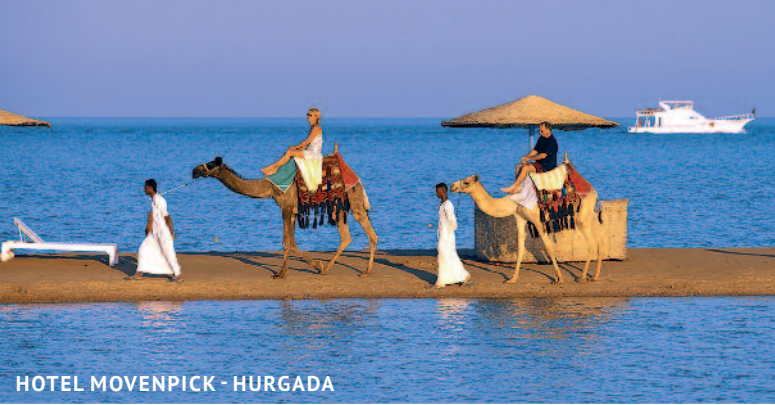
HOTEL MOVENPICK - HURGADA