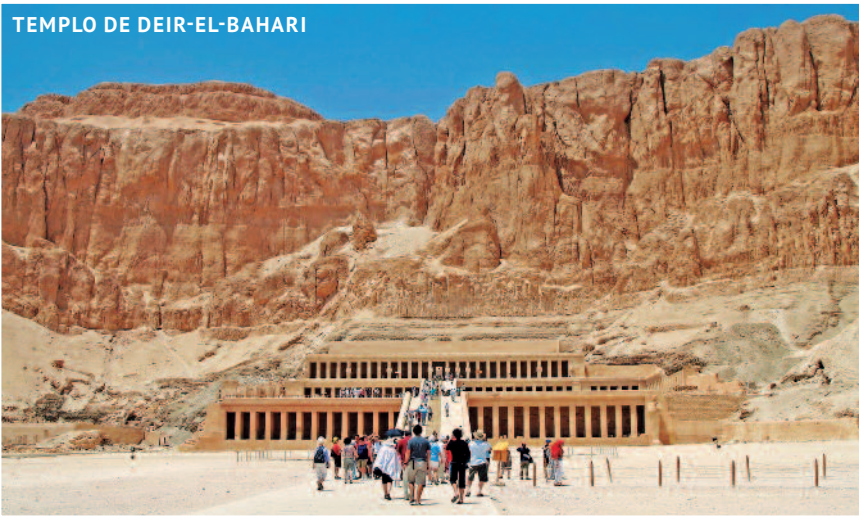
TEMPLO DE DEIR-EL-BAHARI