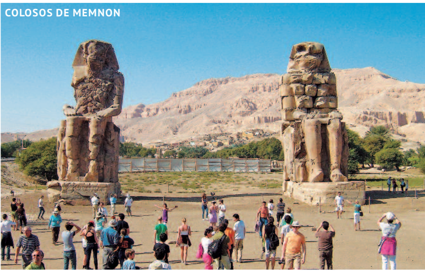
COLOSOS DE MEMNON