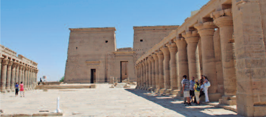
TEMPLO DE PHILAE

A la hora indicada traslado al aeropuerto para salir en vuelo directo con destino Madrid.