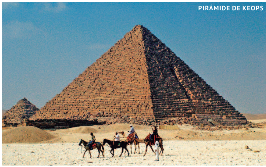
PIRÁMIDE DE KEOPS