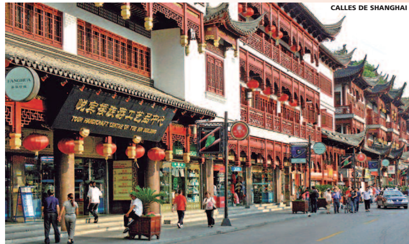
CALLES DE SHANGHAI