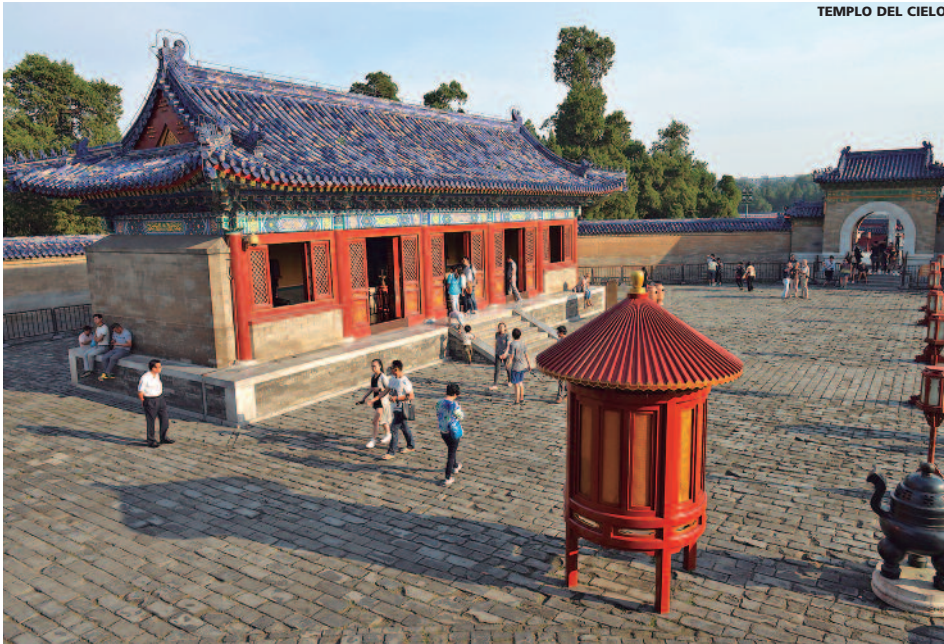
TEMPLO DEL CIELO

Día 1º España/Pekín Presentación en el aeropuerto para salir en vuelo regular, vía punto europeo, con destino Pekín. Noche a bordo. Día 2º Pekín Llegada a Pekín. Traslado al hotel y alojamiento. Día 3º Pekín • Desayuno buffet + almuerzo. Visita panorámica de la ciudad,