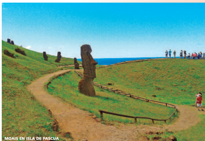
MOAIS EN ISLA DE PASCUA

Nota: Consultar Suplementos en caso de realizar más de una de estas extensiones.