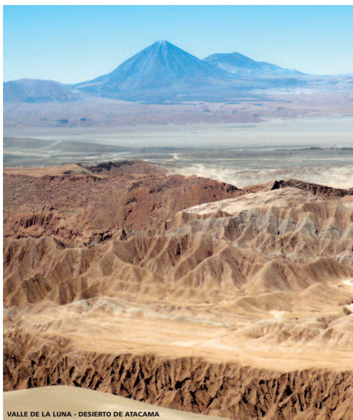
VALLE DE LA LUNA - DESIERTO DE ATACAMA