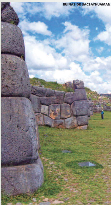
RUINAS DE SACSAYHUAMAN

Llegada a Madrid. (Los Sres. viajeros de Barcelona y otras ciudades continúan en vuelos nacionales a su lugar de origen).