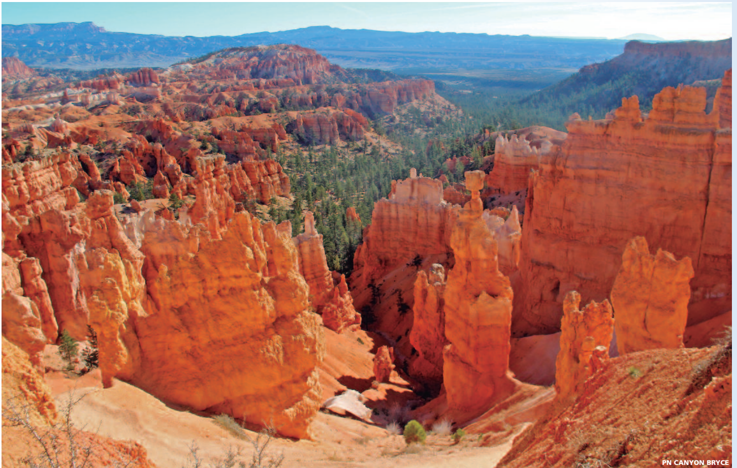
PN CANYON BRYCE