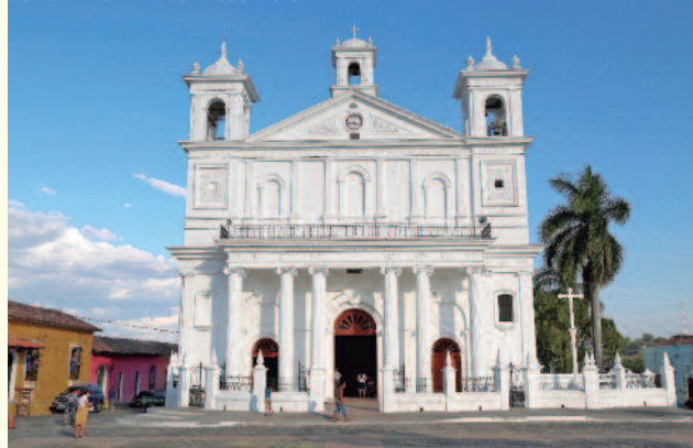
IGLESIA DE SANTA LUCÍA - SUCHITOTO

Notas Importantes: Dependiendo del día de llegada el orden de las visitas puede verse alterado. Para realizar la extensión a El Salvador la salida de Nicaragua tendrá que ser los Lunes, Miércoles, Viernes o Sábado.