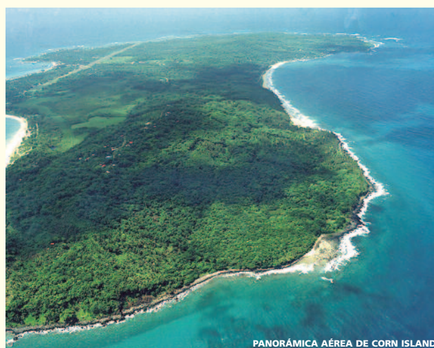
PANORÁMICA AÉREA DE CORN ISLAND

Salida en vuelo a primera hora de la mañana en vuelo con destino a Managua, llegada y posible conexión con vuelo con destino España.