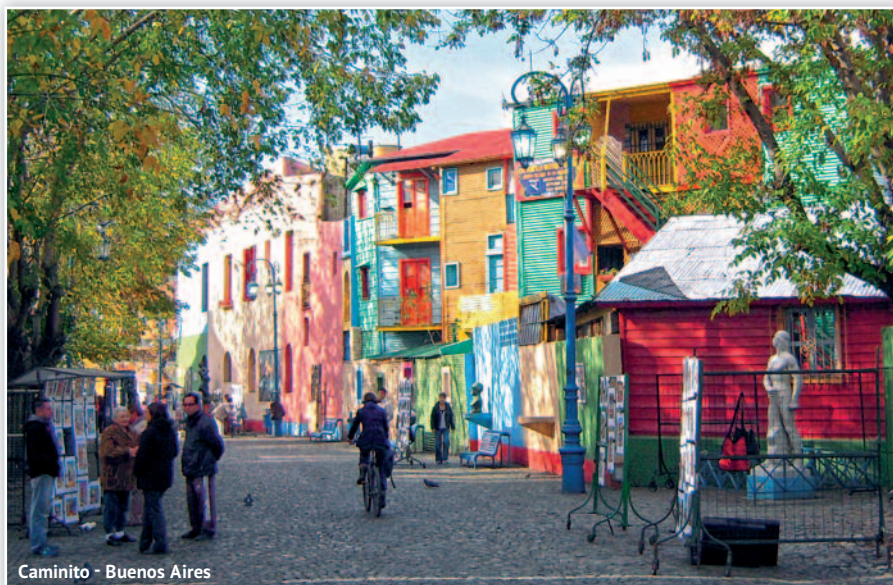
Caminito - Buenos Aires